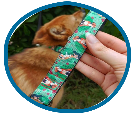
Группа проекта Дело в собаке: vk.com/delovdogs

В 2019-2022 гг. в Санкт-Петербурге выдвигались поправки в 181-ФЗ для закрепления статуса собак-помощников, но они не были приняты .